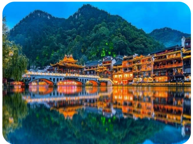
Phượng Hoàng Cổ Trấn